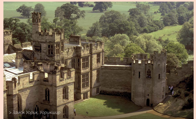
> Замок Уорик, Уорикшир