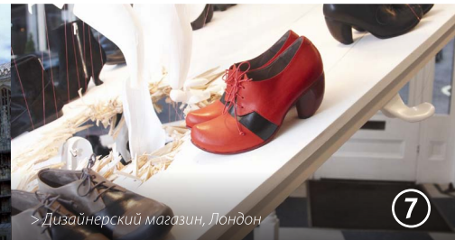
> Дизайнерский магазин, Лондон