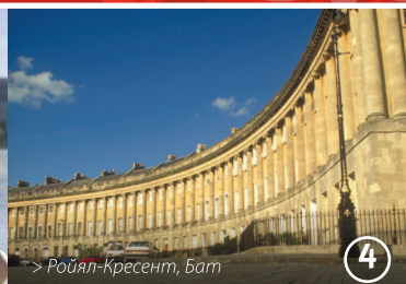
> Ройял-Кресент, Бат