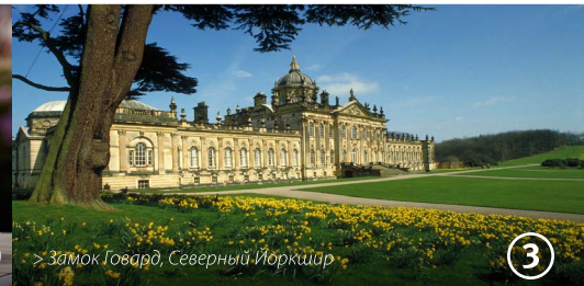
> Замок Говард, Северный Йоркшир