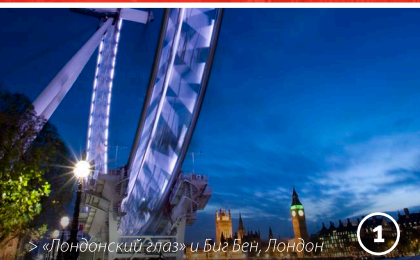
> «Лондонский глаз» и Биг Бен, Лондон

Добро пожаловать в Англию! Наша семидневная поездка идеальна для первого знакомства со страной, которая известна объектами международного наследия ЮНЕСКО, историческими городами, старинными поместьями, английской кухней, богатой культурой и огромным архитектурным разнообразием! Посетите официальные резиденции Королевы, познакомьтесь с бытом викингов и всем тем, что вдохновляло ваших любимых литературных героев.