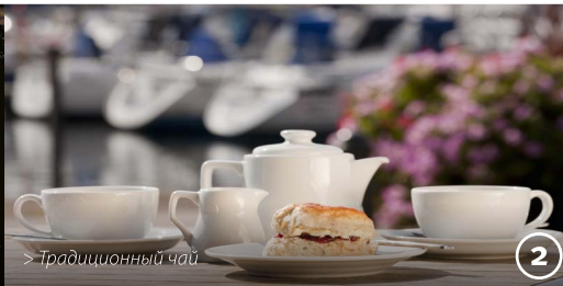
> Традиционный чай