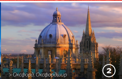
> Оксфорд, Оксфордшир