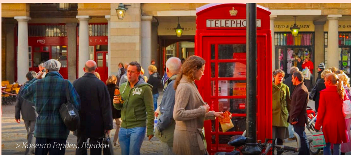
> Ковент Гарден, Лондон

Оставьте вторую половину дня на приобретение сувениров и покупки. Вас ждут свыше 300 магазинов на всегда оживленной Оксфорд-стрит, бутики на Бонд-стрит и в Найтсбридже, колоссальные торговые центры Уэстфилд на востоке и западе Лондона, своеобразные магазины Ковент Гарден и Марилебон-Хай-стрит.