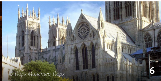
> Йорк Минстер, Йорк