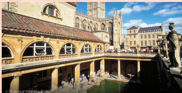
> Римские термы, Бат

Из Бата отправляйтесь поездом в Стратфорд-он-Эйвон, где родился Уильям Шекспир, а вечером посмотрите шекспировскую пьесу в Королевском Шекспировском театре или театре «Суон».