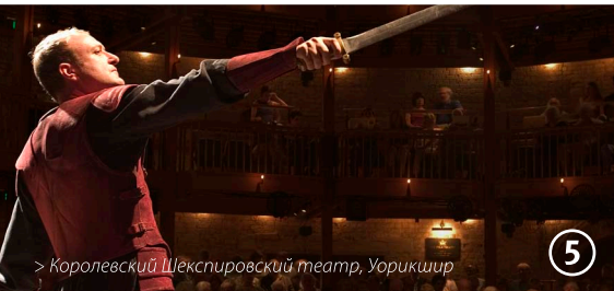
> Королевский Шекспировский театр, Уорикшир