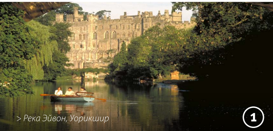
> Река Эйвон, Уорикшир