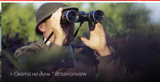
> Охота на дичь