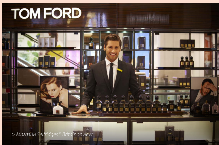
> Магазин Selfridges