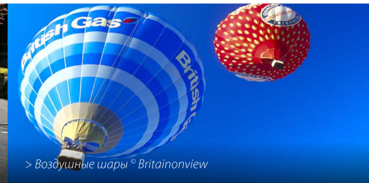
> Воздушные шары