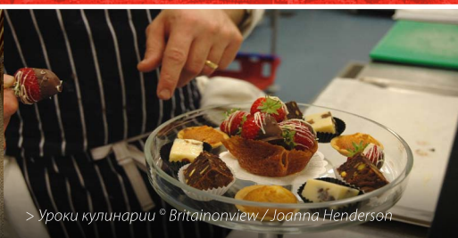
> Уроки кулинарии