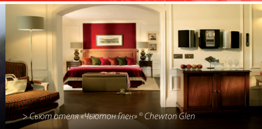
> Сьют отеля «Чьютон Глен»