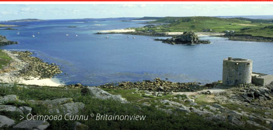
> Острова Силли

Богатый выбор первоклассных ресторанов и щедрая порция самых стильных в мире отелей – лишь часть той роскоши, которую может предложить Англия. Насладитесь бокалом шампанского в окружении королевских особ на скачках, проведите досуг в стиле английских аристократов или отдохните на истинно английском экзотическом острове.