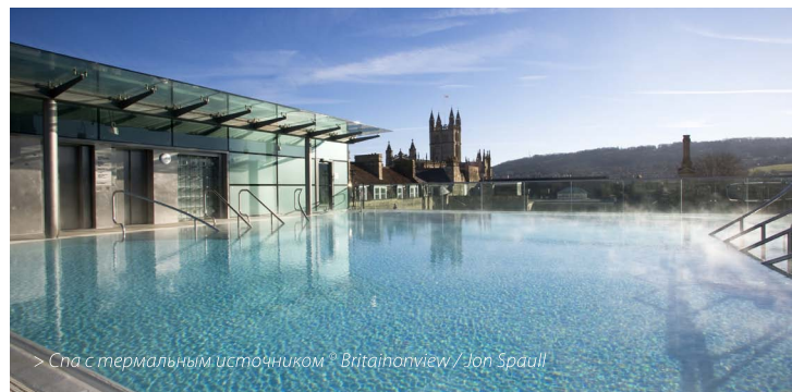
> Спа с термальным источником