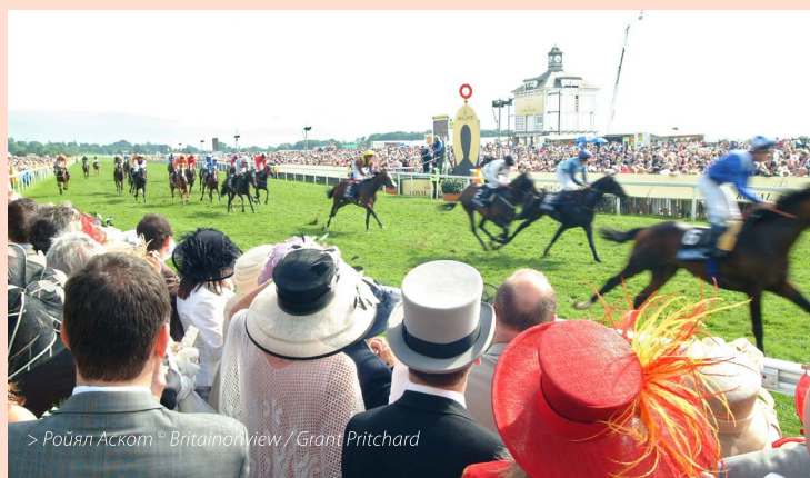
> Ройял Аскот