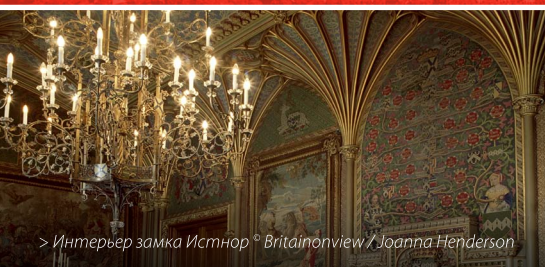
> Интерьер замка Истнор