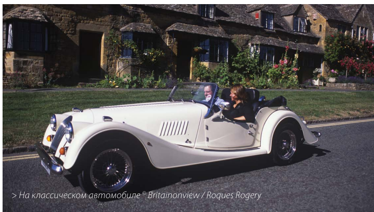
> На классическом автомобиле