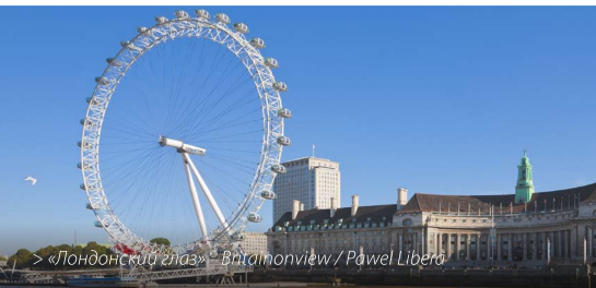
> «Лондонский глаз»