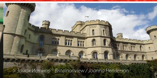
> Замок Истнор