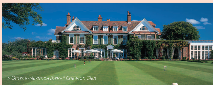
> Отель «Чьютон Глен»